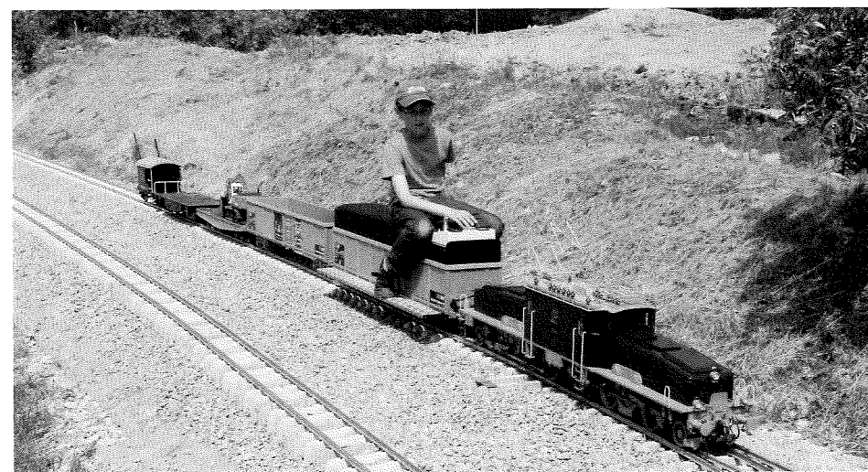
Über den Gleiswechsel regelt Simon die Ge- schwindigkeit der 13254 herunter.