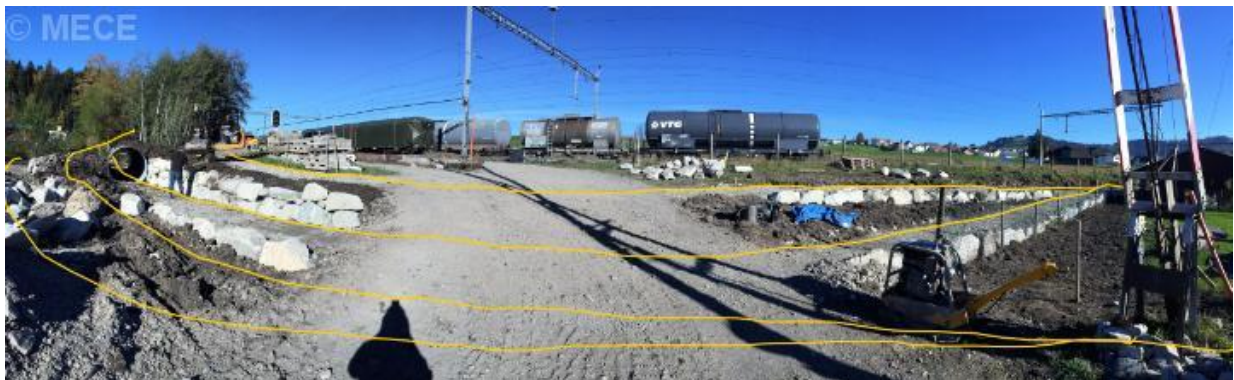
4 Gleise auf 3 Ebenen: erstellter Rohbau für unser Gleis-Trasse